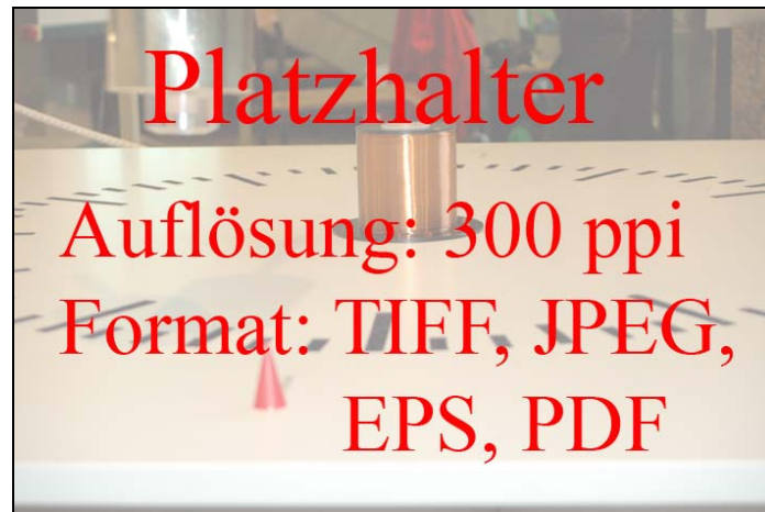
Abbildung 1- Bezeichnung

Num velisis ea conse doloreet ip ea aliquam dolenibh ex eu faci ex etummy nim duis am zzrit aliquatum vulla conum veriliquat utpatem inisit [siehe Wau 00] vulla feuis ent iureet iriusci ero ex estrud dit prat ulla feuisim ipisisis num velit aci tate vullandrem dolorero commolobore do do od eu feu faci bla consectem ad er augait num ad elismod digna adit lut nostrud euguercil init la augiat iustrud magnim doleseuq uametum dolorperos ea feu faci blaortin volore dolobore coreet nisi tatumsandio od eu facinibh enim eum zzriliquis eugiat volessis nis augiamcortin eum zzriurer aliquisismod dolent ate vent lutpat, susto odolobor senis accummod et vercincilis amconsenis o do od eu feu faci bla consectem ad er augait num ad elismod digna adit lut nostrud euguercil init la augiat iustrud magnim doleseuq uametum dolorperos ea feu faci blaortin volore dolobore coreet nisi tatumsandio od eu facinibh enim eum zzriliquis eugiat volessis nis augiamcortin eum zzriurer aliquisismod dolent ate vent lutpat, susto odolobor senis accummod et vercincilis amconsenis