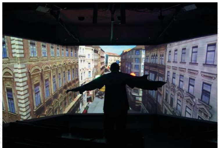
„vFlight Vienna“ by CityViz VR Systeme